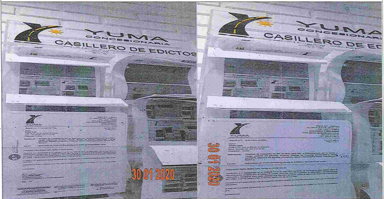
EDICTOS DE LA R_21529 YC-CRT-86816